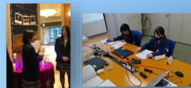
デュアルシステム(職業理解)