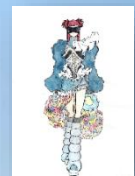
デザインコンクール