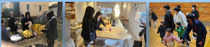
誠実探究(地域の文化・産業の理解等)

地域をフィールドにした活動により実践力を身につけます 商業・服飾の学びから専門的知識・技能を身につけます