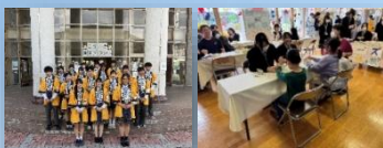
諏実タウン(3科協働)